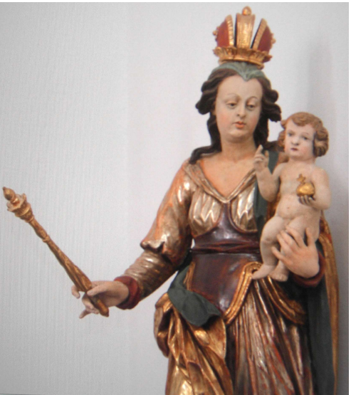
Mutter Gottes mit Jesus (Hauskapelle Kolpinghaus) Ende 17. Jahrhundert, in den 60er Jahren aus dem Diözesanarchiv zur Verfügung gestellt, 2005 restauriert

„Der Sohn Gottes ist nicht nur vom Himmel gekommen und Mensch geworden, um uns vom Himmel, dem jenseitigen Leben, zu erzählen, sondern auch um die menschliche Gesellschaft auf Erden auf bessere und glücklichere Bahnen zu leiten.“