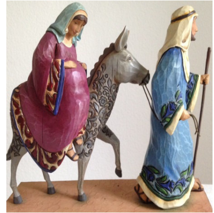
Heilige Familie auf Herbergsuche (geschnitzte Holzfigur, Schnitzer unbekannt)